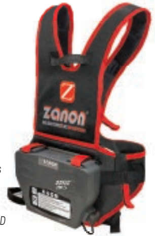
Baterías de la serie DRIVE.S con lectura digital de las funciones de tijera, además de las alarmas que puedan surgir, a través del display LCD