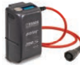
Batterie serie DRIVE.S con lettura digitale delle funzioni della forbice