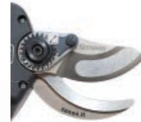
Nuova lama con profilo scaricato per una maggiore penetrazione New blade with unloaded profile for greater penetration Nueva hoja con perfil descargado para mayor penetración