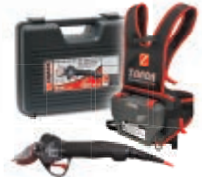
Kit DRIVE 350.S