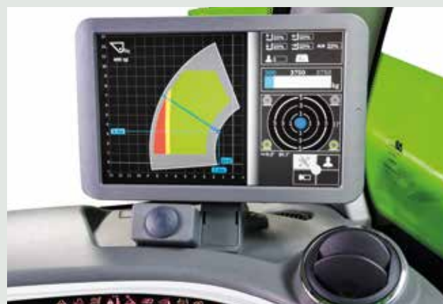
Display sistema di sicurezza